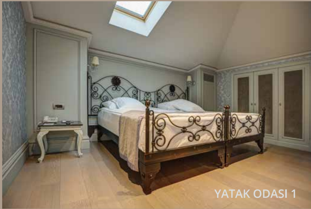
YATAK ODASI 1