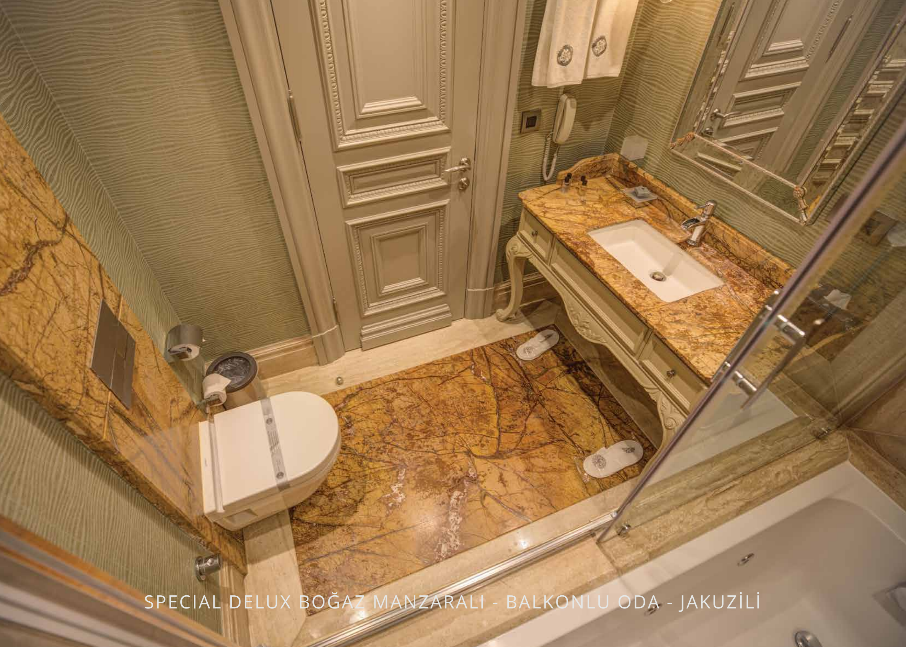
SPECIAL DELUX BOĞAZ MANZARALI - BALKONLU ODA - JAKUZİLİ