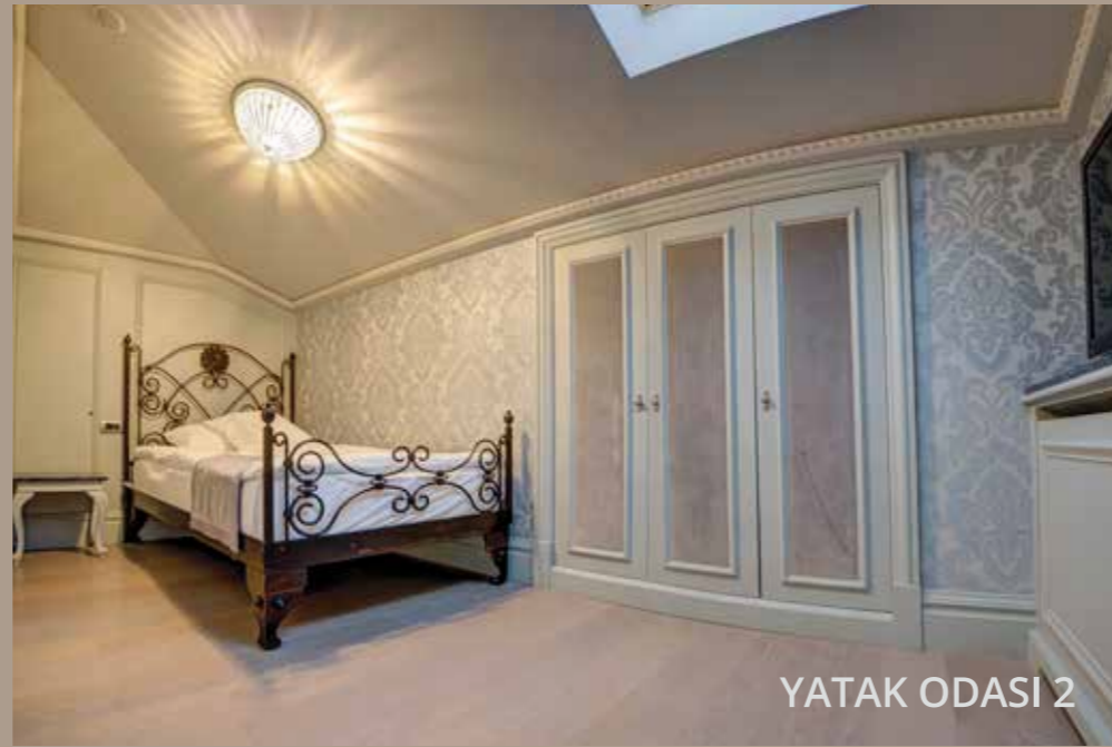
YATAK ODASI 2