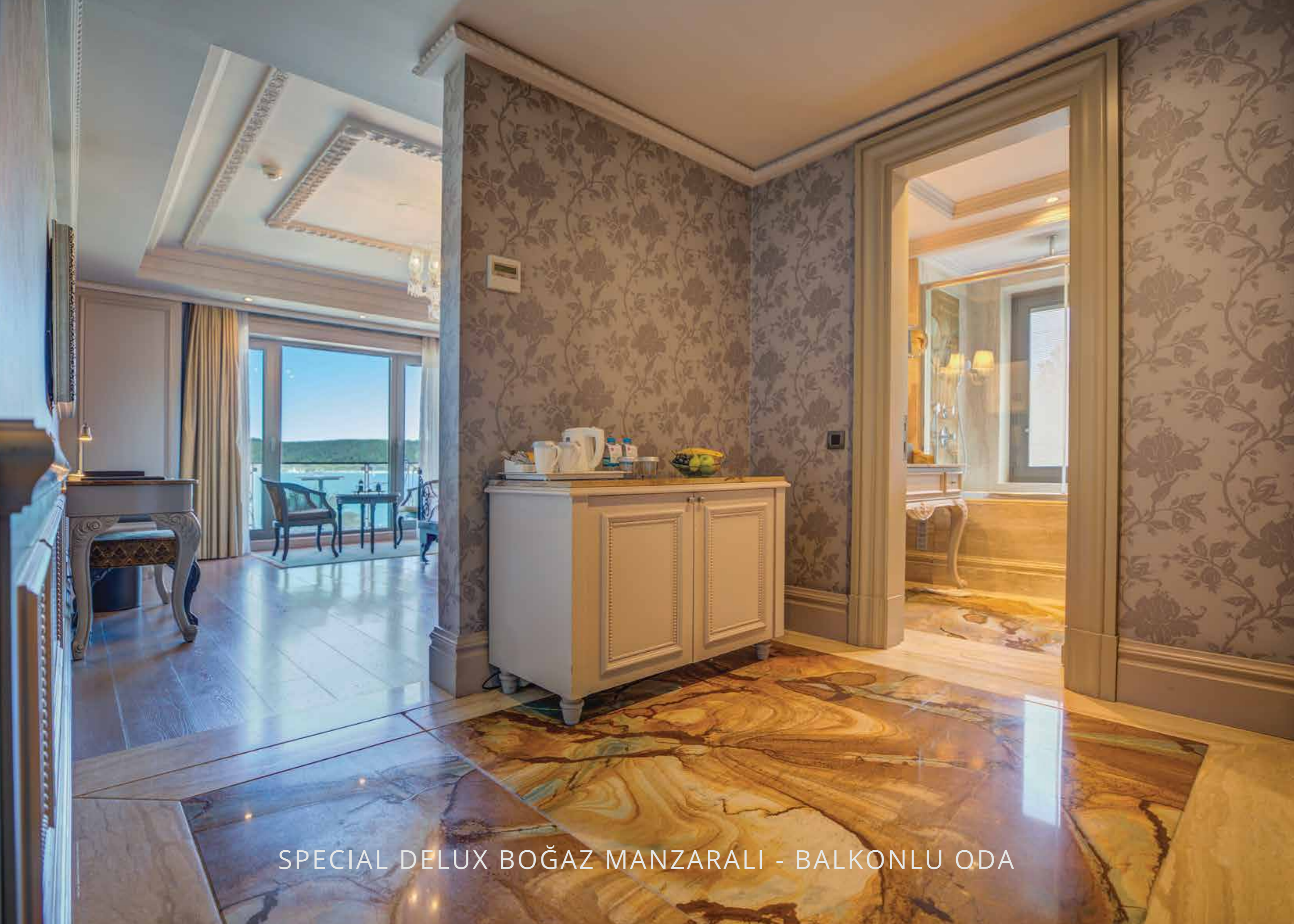
SPECIAL DELUX BOĞAZ MANZARALI - BALKONLU ODA